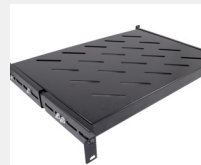
Compatible con bandejas fijas y deslizantes