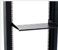
Compatible con bandejas de voladizo