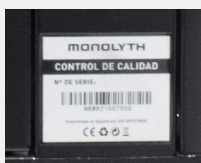
Cumplen las normativas CE y RoHS