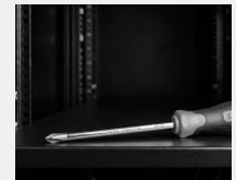
Montaje, instalación y mantenimiento sencillos