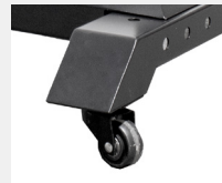
Ruedas giratorias para mejor portabilidad