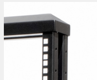
Acabados de calidad para evitar electroestática