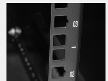
Perfiles de rack numerados