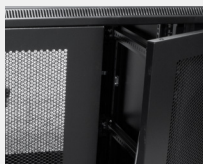
Puerta delantera doble de acero perforado