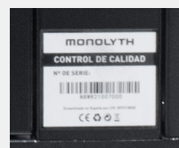
Cumplen las normativas CE y RoHS