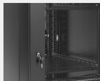
Puerta trasera perforada