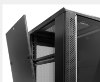
Paneles laterales desmontables de fácil apertura con cerradura