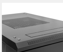
Ranuras de ventilación y entrada de cableado en puerta superior e inferior