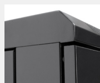
Acabados para evitar electro-estática y entrada de polvo