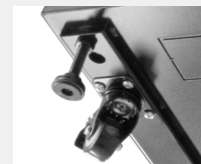
4 ruedas con frenos y pies regulables en altura