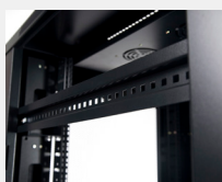
Perfiles desplazables en profundidad