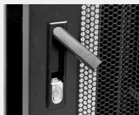
Apertura Handylock en puerta frontal y bombín en puerta posterior