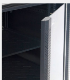
Puerta delantera de cristal templado 5mm