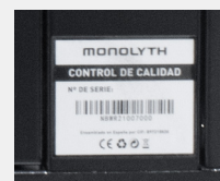
Cumplen las normativas CE y RoHS