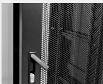
Puerta delantera de acero perforado