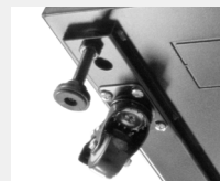
4 ruedas con frenos y pies regulables en altura