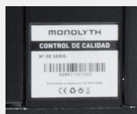
Cumplen las normativas CE y RoHS