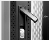
Apertura Handylock en puerta frontal y bombín en puerta posterior